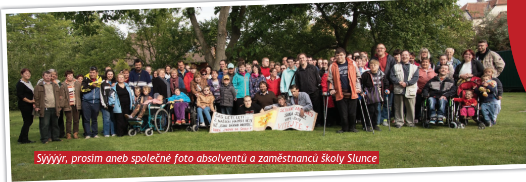
Sýýýýr, prosím aneb společné foto absolventů a zaměstnanců školy Slunce