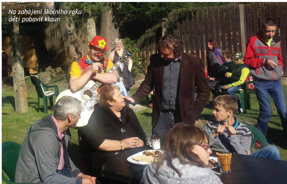
Na zahájení školního roku děti pobavil klaun