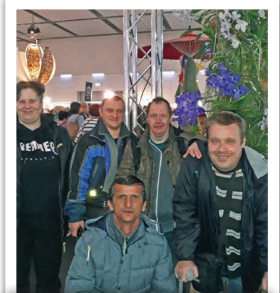
Pro uživatele Centra služeb Slunce všem jsme přichystali výlet do Německa

Uživatelé služeb ze Stochova a Unhoště si na konci března vyrazili opět na výlet. Tentokrát jsme navštívili německé Drážďany a Pillnitz. První zastávka byla v Pillnitzu, kde je zámek a park nacházející se přímo na břehu Labe. Obdivovali jsme krásnou architekturu a zahradnické umění, a v zámeckém skleníku jsme viděli nejstarší a největší kameлии japonskou. Poté jsme už zamířili do Drážďan, kde jsme shlédli výstavu orchidejí.