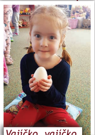
Vajíčko, vajíčko, koho ty skrýváš...:-)

Také v dubnu jsme si pro děti v mateřských školách připravili bohatý program. Se začátkem jara jsme si v bezděkovské školce povídali o mláďatech, která se klubou z vajíček. Děti měly možnost si vajíčka potěžit - byly od slepice, kachny, husy a krůty a následně hádaly, jaké mláďe se z kterého vajíčka vyklubou. Potom pomocí kartiček skládaly celou opeřenou rodinu.