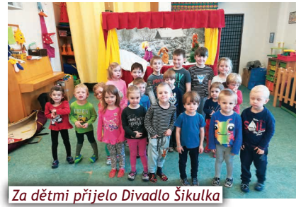
Za dětmi přijelo Divadlo Šikulka