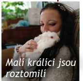
Mali králíci jsou roztomilí

O zvířata v minifarmě v provozu v Lučnici se klienti nejen pečlivě starají, ale také se s nimi mazlí.