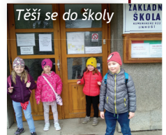
Těší se do školy

Jaké to asi bude sedět v lavici a učit se? To si jeli vyzkoušet do základní školy v Unhošti naši předškoláci z obou mateřských škol.