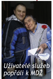
Uživatelé služeb popřáli k MDŽ

Naše milé dámy, uživatelky pečovatelské služby a osobní asistence, jsme v pátek 8. března nezapomněli potěšit přáním a květinou. Všechny měly velikou radost, že jsme si na ně v rámci Mezinárodního dne žen vzpomněli.