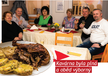
Kavárna byla plná a oběd výborný

V pátek 22. března to v kuchyni Kavárny a pekárně Slunce od rána vonělo pečenou kachnou, která se společně s polévkou kaldoun a zákusky podávala k charitativnímu obědu. Potěšilo nás, že jsme se sešli s našimi přáteli a kamarády a měli jsme možnost si popovídat u dobrého jídla. Na přípravě i průběhu oběda se podíleli lidé se speciálními potřebami a právě jim jsou určeny výtěžky z našich charitativních akcí.