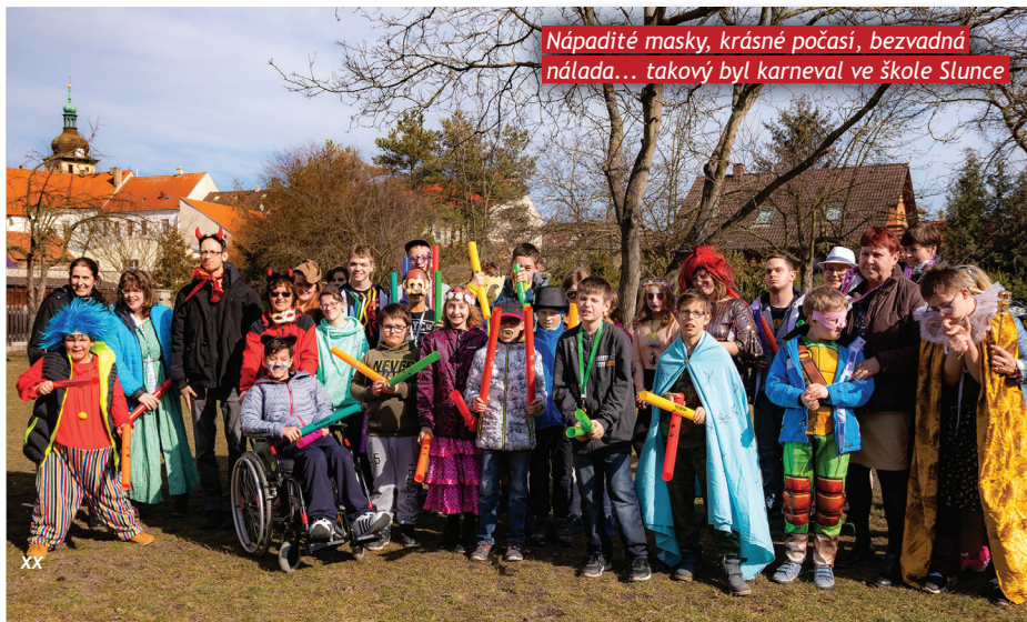
Nápadité masky, krásné počasí, bezvadná nálada... takový byl karneval ve škole Slunce