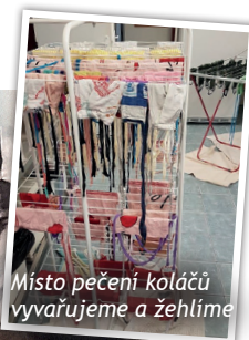
Místo pečení koláčů vyvažujeme a žehlíme