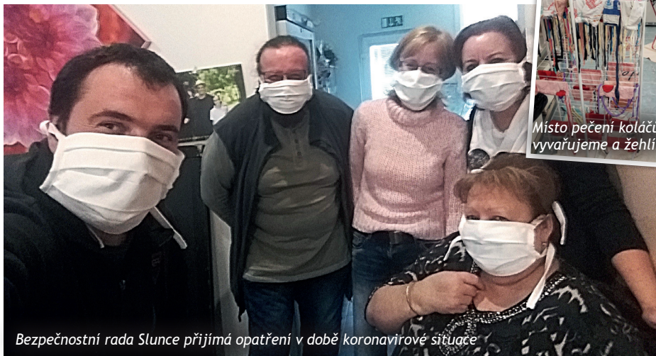
Bezpečnostní rada Slunce přijímá opatření v době koronavirové situace