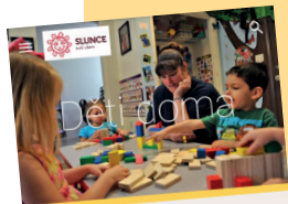
Web DĚTI DOMA spravují pedagogové soukromé školy Slunce a speciálně pedagogického centra (SPC) a pedagogicko-psychologické poradny (PPP) Slunce.

I když je provoz našeho speciálně pedagogického centra a pedagogicko-psychologické poradny Slunce omezený, kolegyně nezahálí. Připravily si pro všechny rodiče nejen našich dětí web s aktuálními informacemi k nastalé situaci a různými zajímavými odkazy a tipy na předškolní a školní přípravu. Web postupně doplňujeme a inspirace bude přibývat, sledujte nás. Můžete také využít chatovacího okna a obrátit se přímo na naše psychology a speciální pedagogy s dotazy týkajícími se aktuálního procesu vzdělávání v domácím prostředí. Těšíme se tam na Vás! www.slunce.info/detidoma