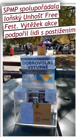
SPMP spolupřátel loňský Unhošť Free Fest. Výtěžek akce podpořil lidi s postižením

Kladenský spolek si dává za cíl rozšířit členskou základnu, iniciovat pobyty pro děti s postižením, organizovat setkání jejich rodičů se vzájemnou výměnou informací a zkušeností, propojování s odborníky, u kterých mohou rodiče získat radu a podporu. Do budoucna by sdružení chtělo více podporovat rodiče dětí s postižením např. organizací wellness pobytů pro maminky. Jde však i o prosazo-