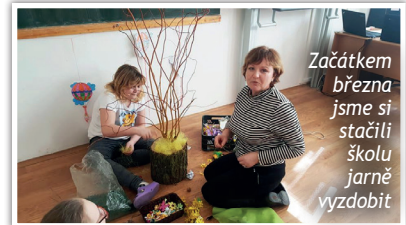
Začátkem března jsme si stáčili školu jarně vyzdobit

Ještě než jsme se rozešli do domácí karantény, jsme se s žáky stochovské školy připravovali na Velikonce. Vyzdobili jsme si jarní třídy a pekli perníkové zajičky. Vypadá to, že letošní velikonoční svátky společně nakonec neoslavíme. Nálada nám však neuvadá a těšíme se na další společné chvíle ve škole po skončení mimořádných opatření.