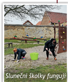
Sluneční školky fungují