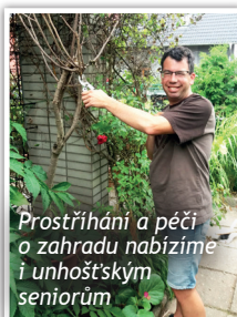
Prostřihání a péče o zahradu nabízíme i unhošťským seniorům

V pobočce Centra služeb Slunce všem v Lučňi v Unhošti se klienti starají o zvířata v minifarmě, zdokonalují se v údržbářské práci a zahradničení.