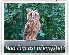
Nad čím asi přemýšlel?

Na chráněné bydlení v Unhošti přilétla v červenci vzácná návštěva. Kalous ušatý z balkonového zábradlí zvědavě nakukoval do oken pokojů našich klientů. Bylo to hezké zpestření odpoledne.