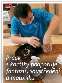
Práce s korálky podporuje fantazii, soustředění a motoriku

Nedávno jsme pořídili také novou sekačku. Staráme se totiž nejen o naše trávníky, ale poskytujeme zahradnické služby i seniorům, kterým posekáme, prostřiháme a zkrášlíme zahrady. ■