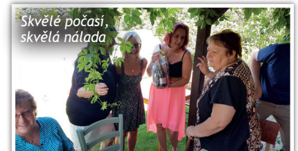
Skvělé počasí, skvělá nálada