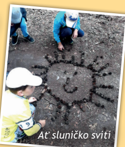
Ať sluníčko svítí