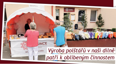
Výroba polštářů v naší dílně patří k oblíbeným činnostem

Každou třetí středu v měsíci pro vás společně s našimi klienty chystáme charitativní Pečení pro dobrou věc. Obzvláště vyhlášené jsou naše koláče, které po celý den připravujeme v chráněné pekárně a ještě teplé putují do stánku. V pekárně a Kavárně Slunce probíhá sociálně terapeutická dílna a program zaměstnávání osob se zdravotním postižením. Pracují zde lidé s hendikepy, kteří zajišťují pomocné práce v kuchyni a obsluhu hostů. A právě jim je určený výtežek Pečení. Děkujeme všem, kteří chodí pravidelně a nákupem pečiva nebo výrobků z naší dílny podporují aktivity Slunce.