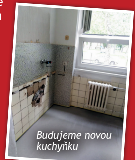
Budujeme novou kuchyňku

Přes prázdniny jsme se ve stochovské škole pustili do rekonstrukce kuchyně, kterou využívají především žáci rehabilitační třídy, ale probíhají v ní i hodiny vaření. Projekt přestavby kuchyně je financován z minigrantu Nadace Veolia a Nadačního fondu Slunce pro všechny. Další novinkou ve Stochově je právě vznikající aktivizační snoezelen místnost, ve které bude probíhat multisenzorická stimulace dětí.