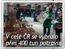
V celé ČR se vybralo přes 400 tun potravin

V sobotu 21. listopadu uspořádala Potravinová banka Sbirku potravin, které jsme se také účastnili. A výsledek byl úžasný. V Kauflandu na pražské Bílé Hoře se nám podařilo vybrat 2 276 kg trvanlivých potravin, které budou využity na pomoc sociálně slabým rodinám, lidem bez domova, seniorům a hendikepovaným dětem a dospělým.