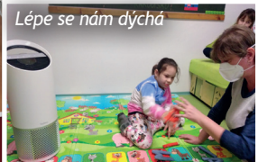
Lépe se nám dýchá