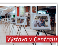
Výstava v Centralu