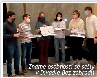
Znamé osobnosti se sešly v Divadle Bez zábradlí

Výtěžek z prodeje kalendáře podporuje děti a dospělé s různými druhy postižení především ve Slunci. V letošním roce pomůže financovat ochranné pomůcky, čističky vzduchu a UV lampy, které jsou nezbytné k zajištění bezpečnosti našich klientů i zaměstnanců v době koronaviru. Kalendář stojí 250Kč a koupit si ho můžete v novém eshopu obchudek.slunce.info , nebo v Kavárně Slunce v Unhošti. ■