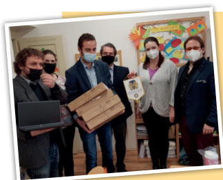
Dar Rotary Klubu pomůže připojit další děti do případné distanční výuky