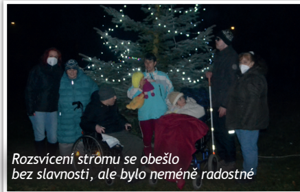
Rozsvícení stromu se obešlo bez slavnosti, ale bylo neméně radostné

Dlouholetým zvykem již bývá, že každý rok v pátek před prvním adventním víkendem rozsvěcujeme "sluneční" vánoční strom. Na zahradě Domova dobré vůle v Nouzově se sejde plno našich podporovatelů, přátel, rodičů našich klientů i žáků a zpíváme koledy, dáváme si svařák a cukroví i oblíbené klobásy. Letos to však bylo trochu jinak, jako ostatně plno věcí v tomto roce. Tradice byla zachována, jen my jsme u toho chyběli. V pátek 27. listopadu obyvatelé a zaměstnanci domova oslavili začínající vánoční čas a strom rozsvítili. Nechyběly ani klobásy. Vstoupili jsme tak do času adventu a moc bychom si přáli, abychom jej prožili klidně, v pohodě a především ve zdraví.