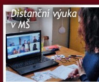
Distanční výuka v MŠ

V Horním Bezděkově si učitelky nachystaly bojovou hru Tajemství modrého kamene. V blízkém lese v katastru obce rozmístily stanoviště s úkoly, které pak děti se svými rodiči plnily. Na konci cesty je čekalo hledání modrého kamene a vyslovení tajné formule pro odehnaní zimy. Jsme rádi, že se děti z obou našich školek pobavily a hry se líbily. Nechyběla ani společná příprava na Velikonce, byť na dálku.