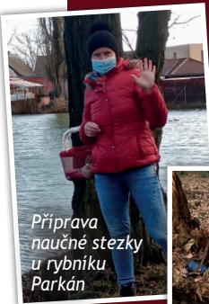
Příprava naučné stezky u rybníku Parkán