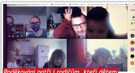
Poděkování patří i rodičům, kteří dětem s distanční výukou pomáhají

Některým žákům byly zapůjčeny darované notebooky, které škola dostala od Rotary klubu Staré město. Dětem ze znevýhodněných rodin pomohou zajistit vzdělávání při distanční výuce. Další počítače pro za-