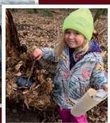
Radost dětí po nalezení modrého kamene byla velká