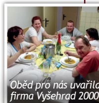
Oběd pro nás uvařila firma Vyšehrad 2000

Na zelený čtvrtek se uskutečnil společný velikonoční oběd pro klienty Centra služeb Slunce všem. Dodrželi jsme aktuální opatření a oběd jsme zorganizovali po menších skupinkách ve všech našich zařízeních tak, aby se uživatelé vzájemně nemíchali. Díky teplému počasí si v Domově dobré vůle Slunce v Nouzově dokonce prostřeli venku v altánu. Oběd byl příjemným zpestřením a oslavou jara a velikonočních svátků.