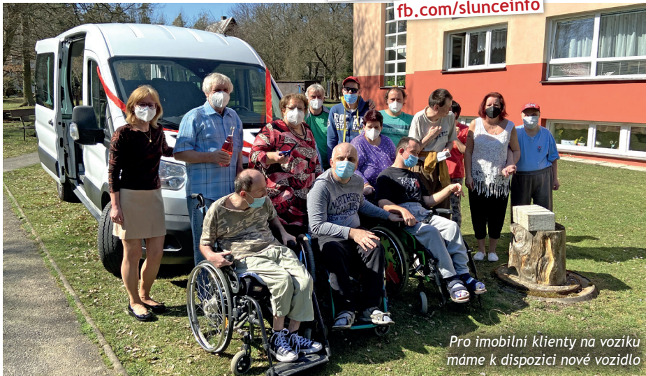
Pro imobilní klienty na vozíku máme k dispozici nové vozidlo

► Více fotek na našem facebooku: fb.com/slunceinfo