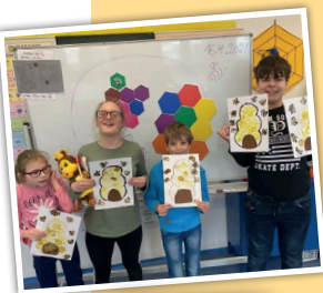
Žáci jsou zpět ve škole