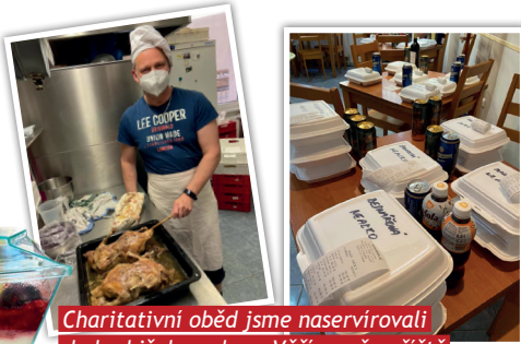
Charitativní oběd jsme naservírovali do krabiček s sebou. Věříme, že příště už se u nás i posadíte minimálně na zahrádce.

Poslední dubnový den místo sladkých vůní provoněla pekárnu pečená kachna. Chystali jsme charitativní čarodějnický oběd, který jsme z důvodu přetrvávajících koronavirových opatření balili s sebou. Všichni, kdo si včas objednali si tak pochutnali na dozlatova upečené kachně, zelí a knedlicích. Jsme rádi, že Vám oběd chutnal a děkujeme za objednání. I díky