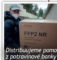
Distribuuje pomoc z potravinové banky

Každý týden jezdíme do potravinové banky a díky tomu můžeme poskytovat pomoc sociálně slabým rodinám, zdravotně postiženým osobám i lidem v tíživé situaci. Naposledy jsme kromě potravin přivezli i respirátory, za které velice děkujeme.