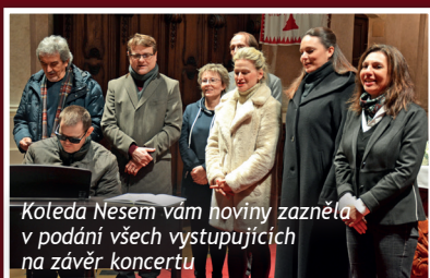
Kolekta Nesem vám noviny zazněla v podání všech vystupujících na závěr koncertu