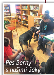
Pes Berny s našimi žáky