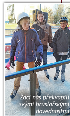
Žáci nás překvapili svými bruslařskými dovednostmi

Volný den připravili pedagogové pro žáky unhoštské školy Slunce. Ještě než se všichni rozešli na vánoční prázdniny, společně si zašli v Kladně na bowling a zabruslit si na veřejné kluziště v Kročehlavech.