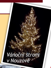
Vánoční strom v Nouzově