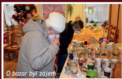
O bazar byl zájem