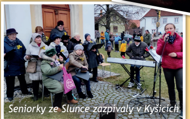
Seniorky ze Slunce zazpívaly v Kyšicích

Pátek před prvním adventním víkendem jsme rozsvítili vánoční strom v Domově dobré vůle v Nouzově. Do poslední chvíle jsme doufali, že akce bude veřejná, bohužel však kvůli zhoršující se covidové situaci jsme byli nuceni na poslední chvíli program změnit a stejně jako vloni ho udělat komorní jen s uživateli, kteří v domově bydlí. Hezký advent jsme si popřáli alespoň na dálku.