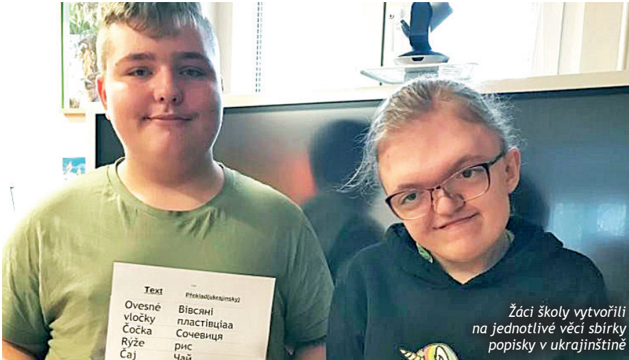
Žáci školy vytvořili na jednotlivé věci sbírky popisky v ukrajinštině