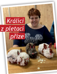
Králičci z pletací příze

V rámci denního stacionáře se s klienty věnujeme řadě kreativních činností. Mezi ty oblíbené patří práce s pletací vlnou. Abychom si zkrátili čekání na jaro, vytvořili jsme krásné jarní ušáky.