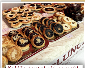
Koláče tentokrát pomohly lidem zasaženým zemětřesením

Výtěžek únorového Pečení pro dobrou věc jsme se rozhodli věnovat lidem zasaženým devastujícím zemětřesením v Turecku a Sýrii. Za koláče, další pečivo a výrobky jsme vybrali krásných 16 tis. Kč, které Nadační fond Slunce pro všechny odeslal Českému červenému kříži na sbírkový účet zřízený přímo na pomoc obětem zemětřesení. Vážíme si každého z Vás, kdo jste se i malým obnosem rozhodli s námi přispět.