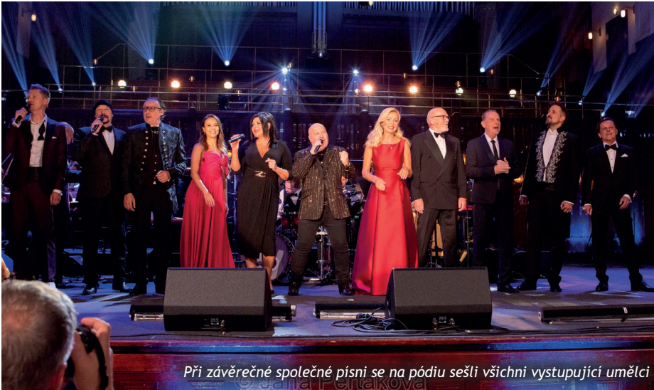
Při závěrečné společné písni se na pódiu sešli všichni vystupující umělci